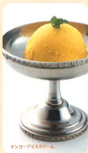
マンゴーアイスクリーム

D13 CARAMEL CINNAMON キャラメルシナモン 150 (+税) yen (税込 165yen)