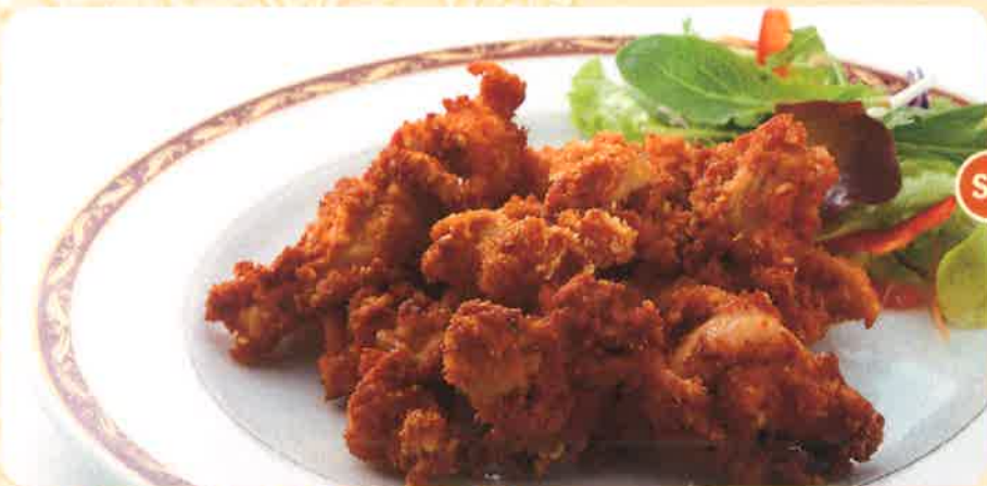
S3 CHICKEN PAKORA チキンパコラ インド風からあげ 540 (+税) yen (税込 594yen)