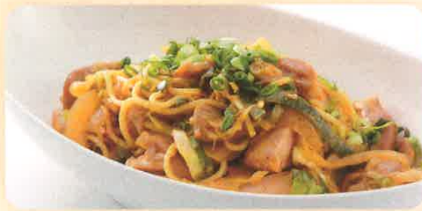
S5 CHOWMEN チョーメン 640 (+税) yen (税込 704yen) インド風焼きそば