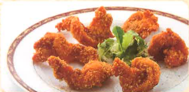
S1 GOMA FRIED PRAWN エビのごま衣揚げ 680 (+税) yen (税込 748yen) エビをごまの衣でサクッと揚げました