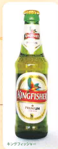
キングフィッシャー

B3 SUNTORY ALL FREE サントリーオールフリー 320 (+税) yen (税込 352yen) (ボトル334ml) ノンアルコールビール