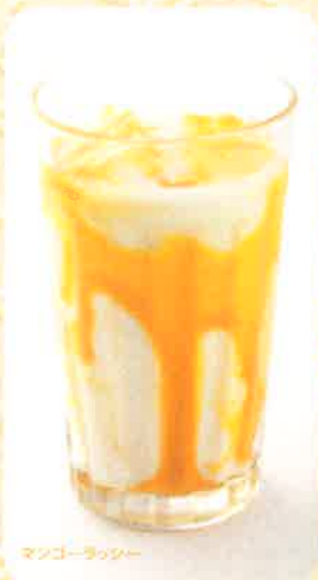
マンゴーラッシー

D2 MANGO LASSI マンゴーラッシー 300 (+税) yen (税込 330yen)