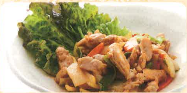
S4 CHICKEN CHAAT チキンチャート 640 (+税) yen (税込 704yen) インドスパイスで味付けしたチキンと野菜の炒め物