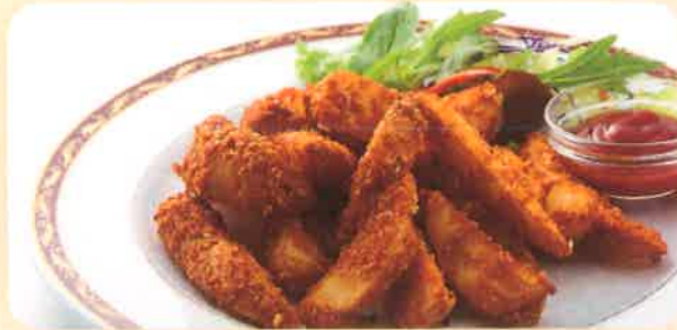
S2 POTATO FRY ポテトフライ 420 (+税) yen (税込 462yen) インド風の衣で上げたポテトフライ