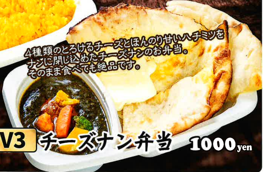
V3 チーズナン弁当 1000 yen

4種類のとろけるチーズとほんのり甘いハチミツを ナンに閉じ込めたチーズナンのお弁当。 そのまま食べても絶品です。