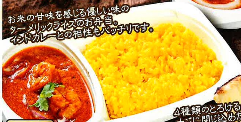
V2 ライス弁当 790 yen

お米の甘味を感じる優しい味の ターメリックライスのお弁当。 インドカレーとの相性もバッチリです。