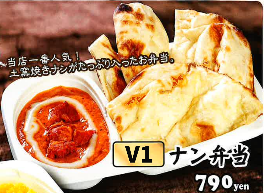
V1 ナン弁当 790 yen

※写真はイメージです。 ※ビニール袋は1枚3円です。 ※ターメリックライス は日本米を使用しています。